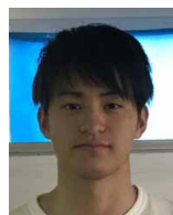
経 済 70 期 五 藤 廉